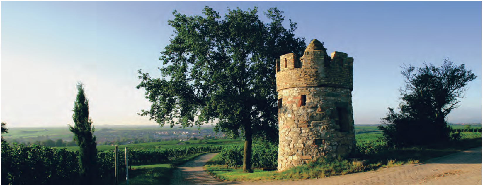
Wunderschöner Blick auf Alzey: vom Juliierturm