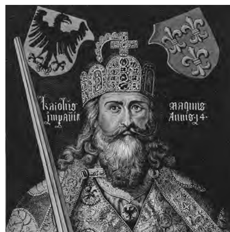
Von Albrecht Dürer verewigt: Karl der Große