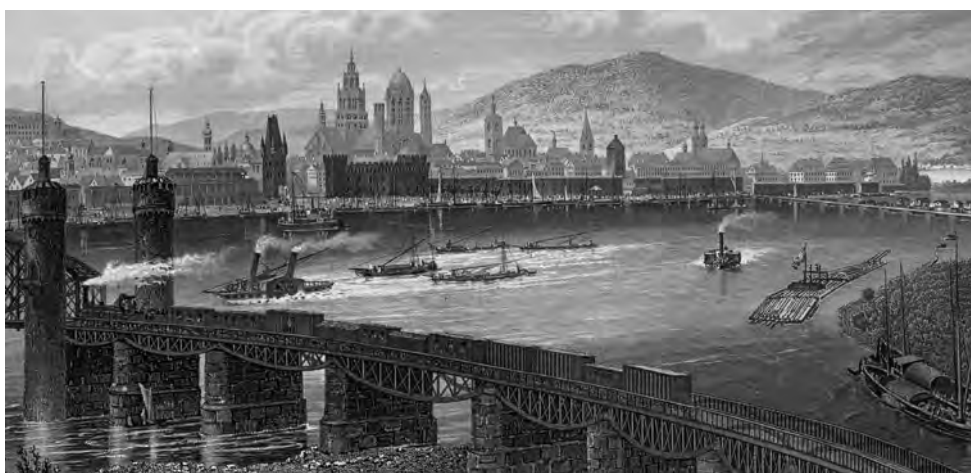
Das historische Mainz um 1874

Unweigerlich stößt man auf der Suche nach dem Ursprung des Weinbaus in Deutschland auf die Römer. Das Besondere an Rheinhessen: Als römische Truppen das Legionslager Moguntiacum – das heutige Mainz – auf dem Gebiet der Unikliniken und dem Kästrich errichteten, fanden sie bereits Reben vor. Es entwickelte sich eine halb-militärische Lagerstadt, die Hauptstadt der Provinz Obergermanien; von Mainz aus wurde