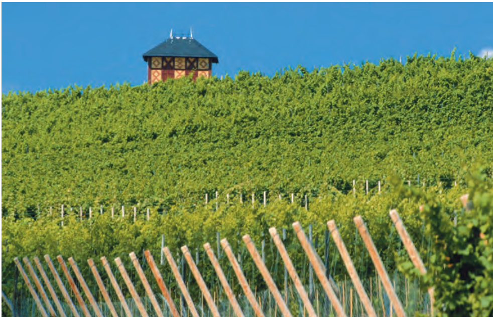
Rheinhessen wird auch das "Land der 1 000 Hügel" genannt