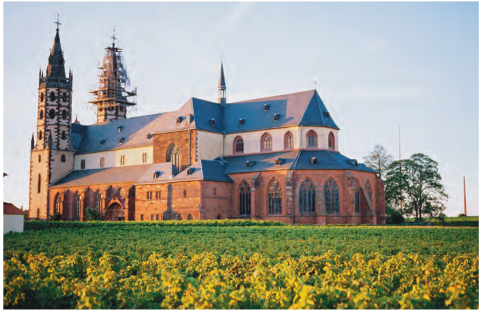
Berühmtes Clos: das Wormser Liebfrauenstift, Mutter der Liebfraumilch