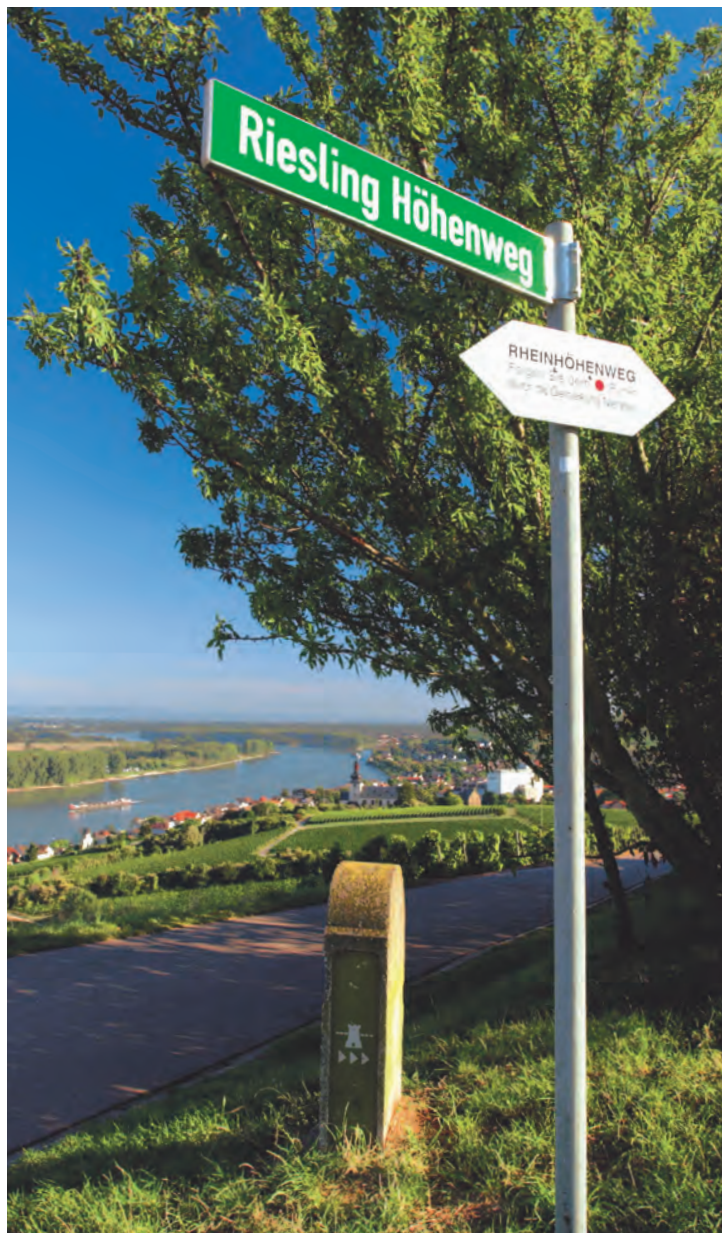
Riesling ist in Rheinheßens neben dem Silvaner die angesagte Rebsorte